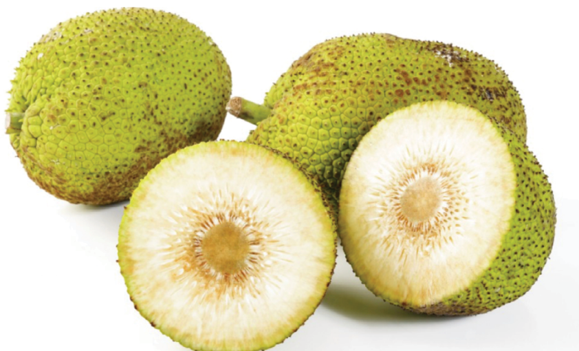
Slika 12: Kruhovec, koristi za zdravje, http://healthybenefits.info/the-health-benefits-of-consuming-bread-fruit%E2%80%8F/

Še enkrat pogledjmo Groarkejevi fotografiji (z vidika percepcije, obdelave in konstrukcije pomena je za gledalca pomembno, da sta vključeni med nove fotografije (ploda kruhovca) in da ju ne omenjamo le s številkami (npr. slika 11)). Že videna: